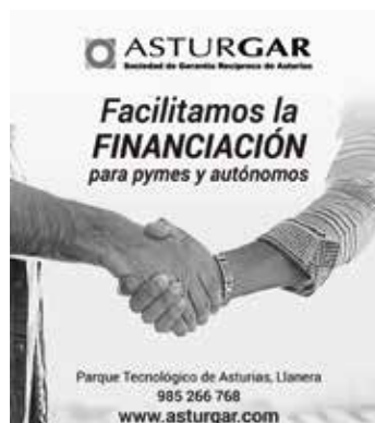
Imagen gráfica de la campaña

El pasado año llevamos a cabo una importante campaña de publicidad destinada a pymes y autónomos, que se centró principalmente en inserciones en prensa y radio en Asturias. Con el lema “Facilitamos la financiación para autónomos y pymes”, pretendíamos llegar a las pequeñas y medianas empresas y a los emprendedores asturianos, dando a conocer cinco programas de financiación: financiación, anticipo de subvenciones, líneas de avales, avales específicos y asesoramiento.