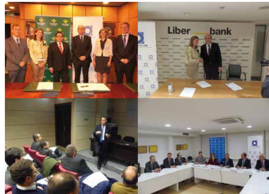
Diferentes acuerdos de colaboración con entidades bancarias

Durante el ejercicio 2016, más de 150 gestores pertenecientes a 10 entidades, han pasado por alguno de los 12 Talleres organizados por Asturgar.