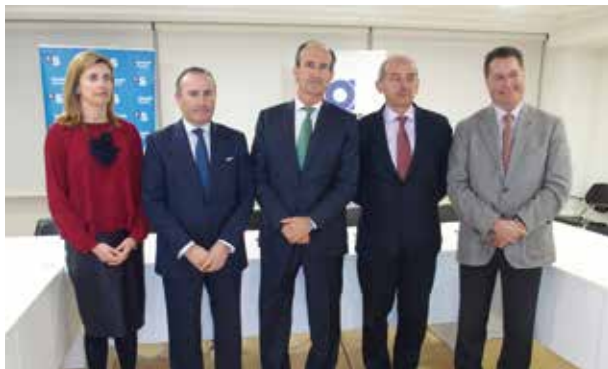
Asturgar, junto a las tres Cámaras de Comercio y SabadellHerrero

Por primera vez Asturgar, las tres Cámaras de Comercio y SabadellHerrero alcanzaron en 2016 un acuerdo conjunto con el objetivo que los emprendedores, autónomos y micro pymes de Asturias tengan fácil acceso a la mejor financiación.