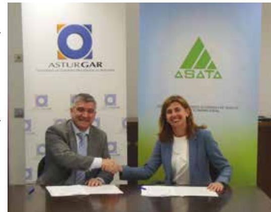
Asturgar y ASATA sellan una nueva alianza

Durante 2016 algo más del 8% de los socios avalados por Asturgar fueron cooperativas o sociedades laborales, formalizándose garantías por más de 710.000 euros.