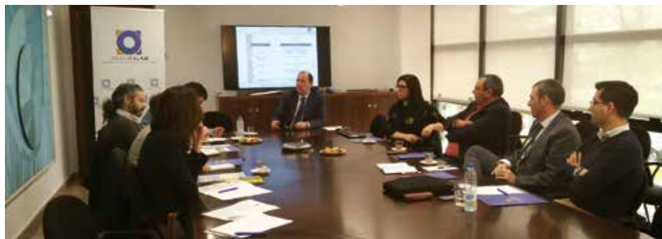
El director general de Asturgar, junto a los periodistas de los diferentes medios

Una iniciativa que fue muy bien recibida por los medios asistentes y que sirvió de nexo de unión con los periodistas que habitualmente cubren las informaciones de Asturgar.