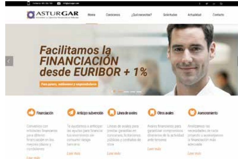
Imagen principal de la nueva web de Asturgar

Con una línea de diseño clara y sencilla, la página ha sido creada según el modelo responsive que facilita su uso desde dispositivos móviles, incorporando como novedad el acceso al apartado de noticias y a las redes sociales de la SGR, así como la participación activa de los socios de Asturgar a través de vídeos en el que relatan su desarrollo empresarial y su relación con nosotros.